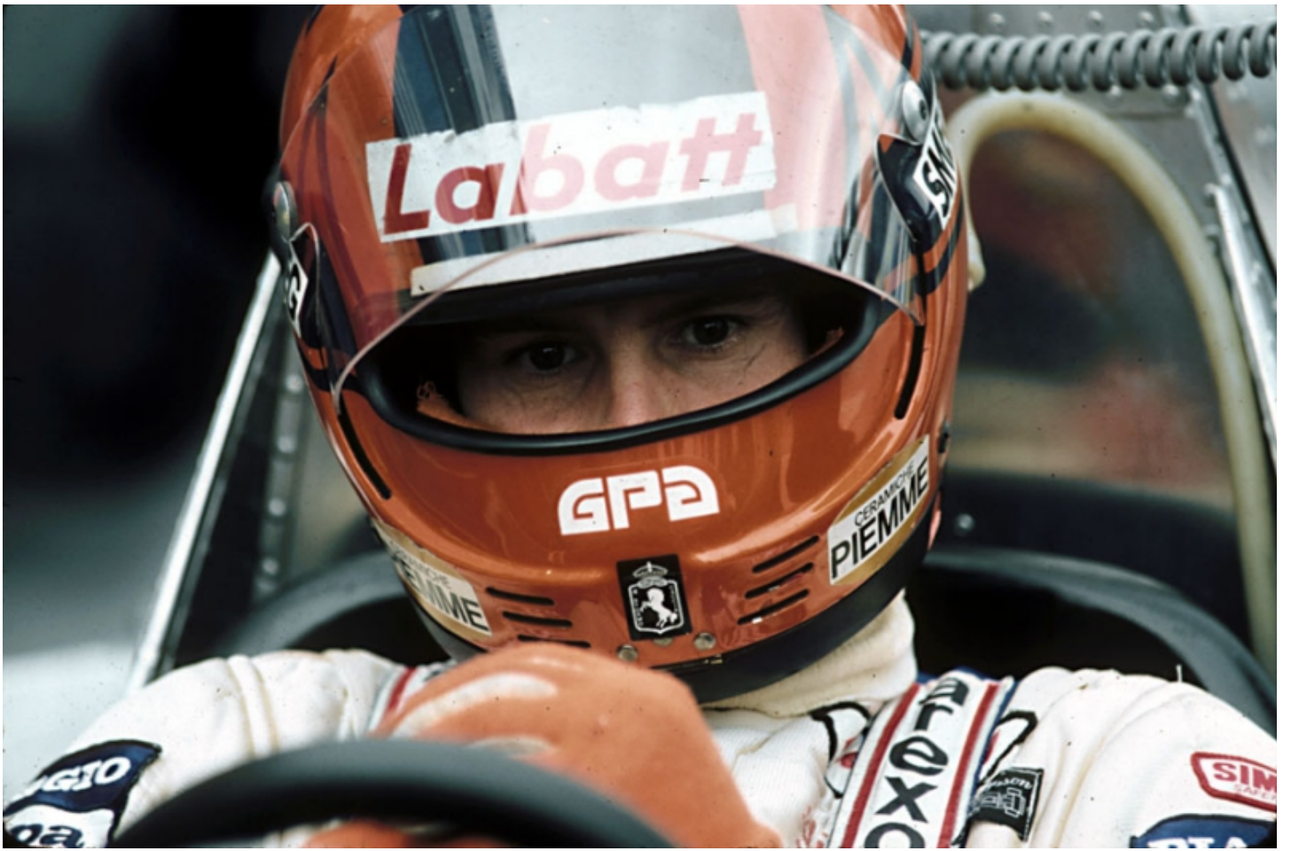
'81 French GP