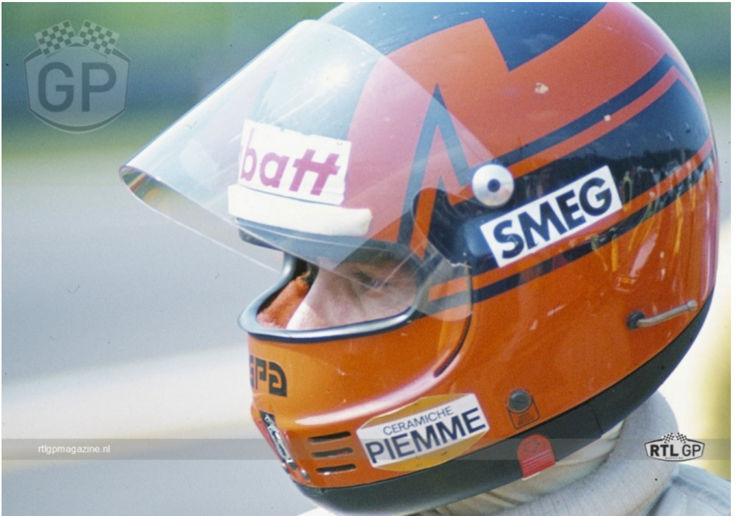
'81 Belgian GP